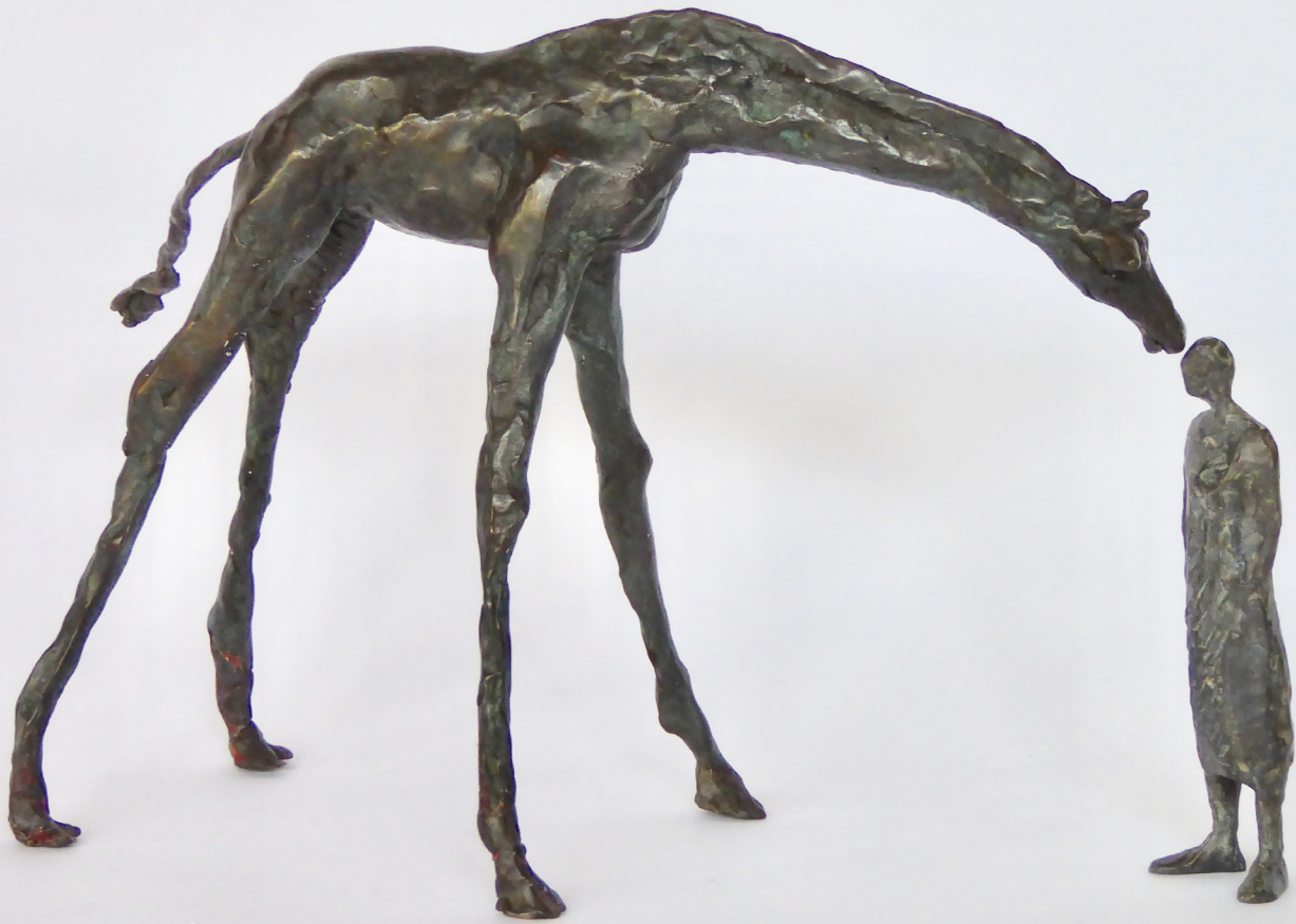
La consolation de la girafe

Réflexion sur le sentiment des animaux à notre égard, la plupart du temps, ils sont curieux et très bienveillants.