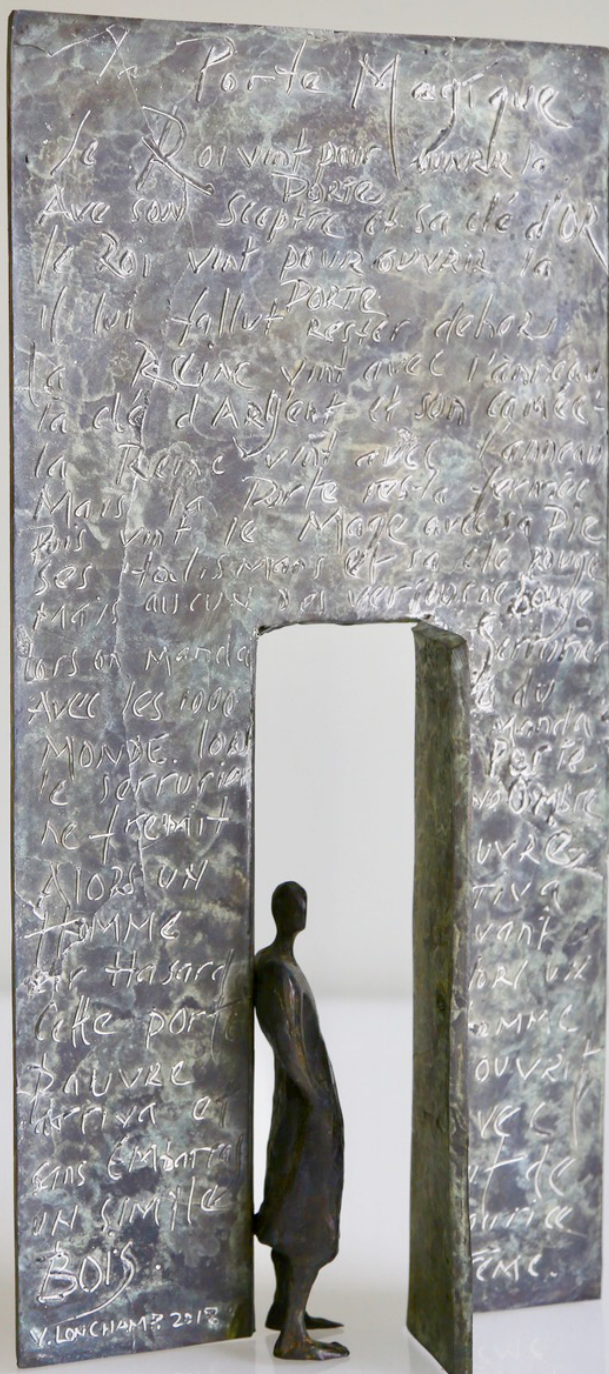
La porte magique