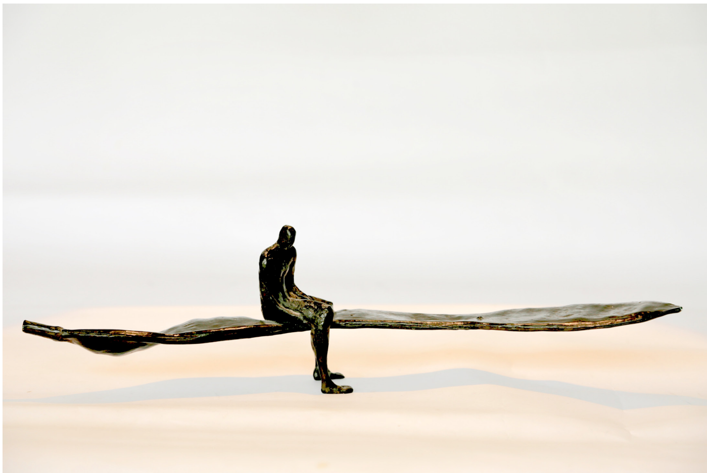
En attendant la belle vague