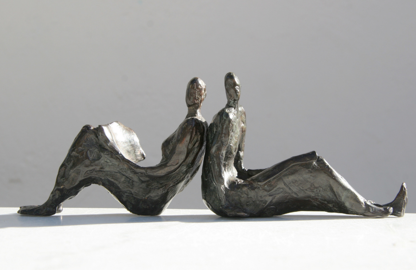
Dos à dos