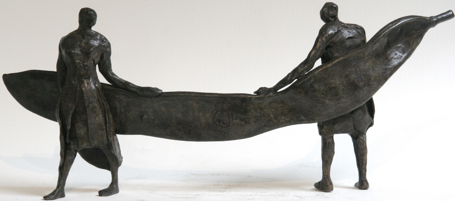
La vie à deux

«Les hommes, certes – c'est l'humanité qui est première ici. Mais le monde végétal, de façon plus souterraine, est régulièrement convoqué et présent : des bouts de bois flottant, des fruits de caroubier.» Juliette Solvès