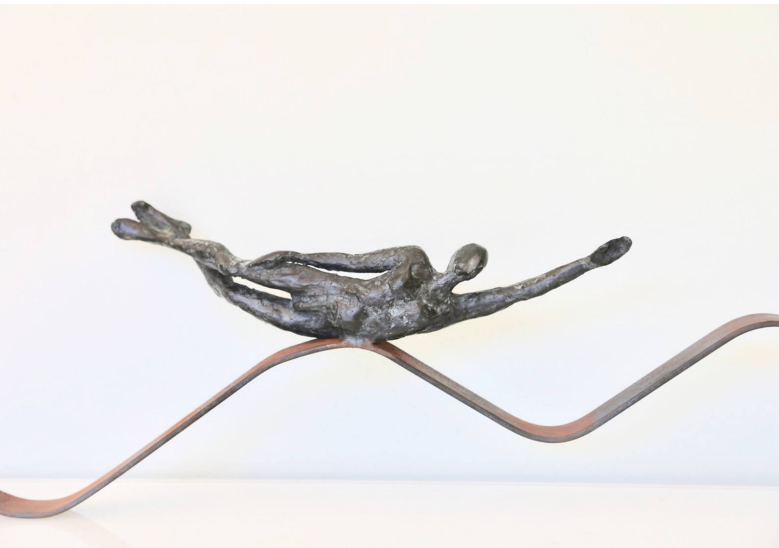
Prendre la vague