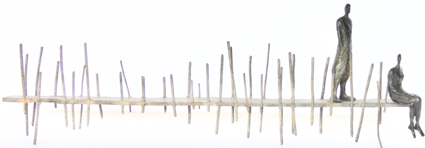
L'espace temps et nous