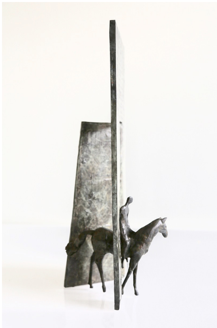
Le retour d'Hadrien