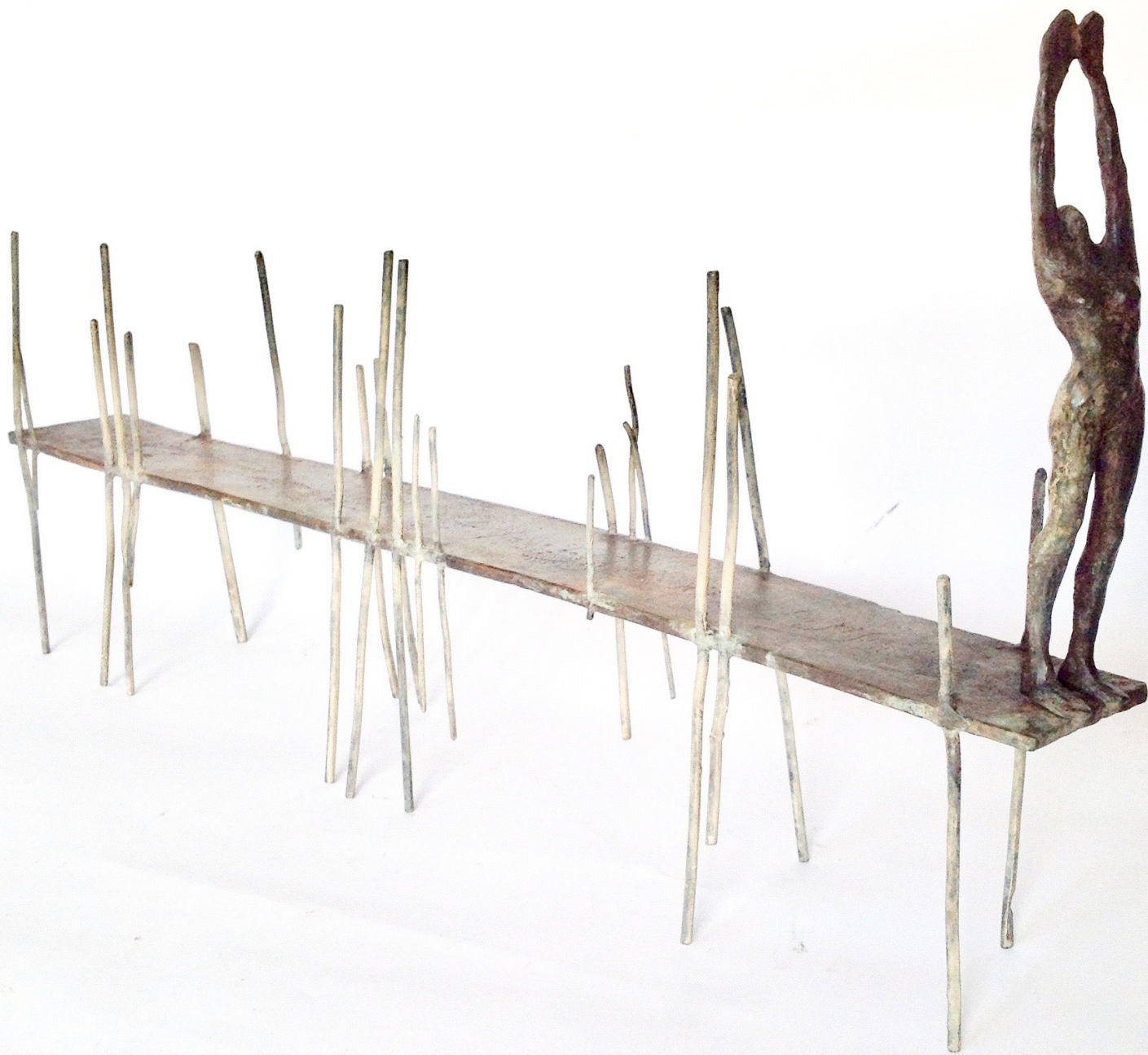
Mon salut au soleil