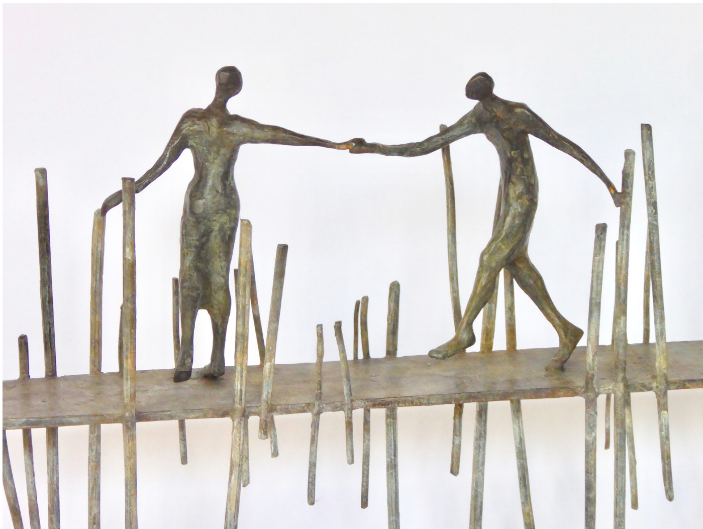
Come on my love